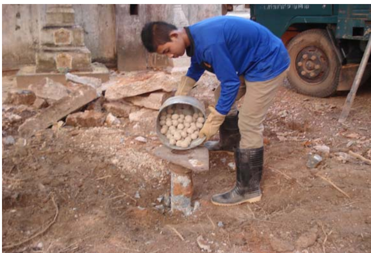
อุดกลบด้วยดินเหนียวน้ำจืด เนื้อเนียนบริสุทธิ์ปั้นลูกกลม ขนาด 3 เซนติเมตร