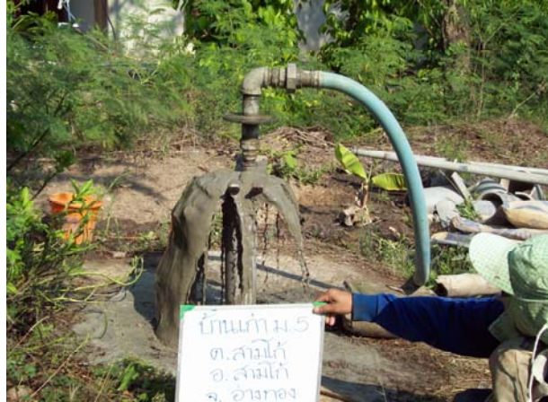
การอัดปูนซีเมนต์ลงในบ่อน้ำบาดาล