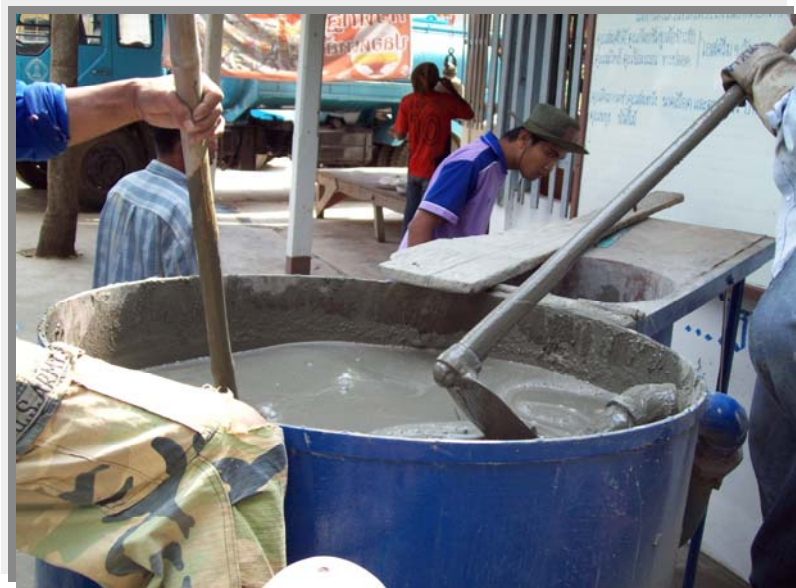
ผสมปูนซีเมนต์