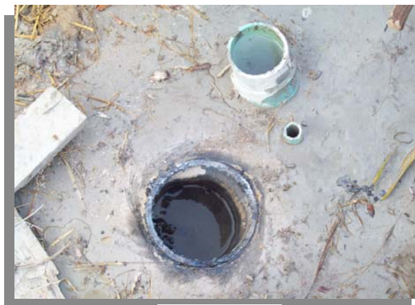
การตัดท่อ