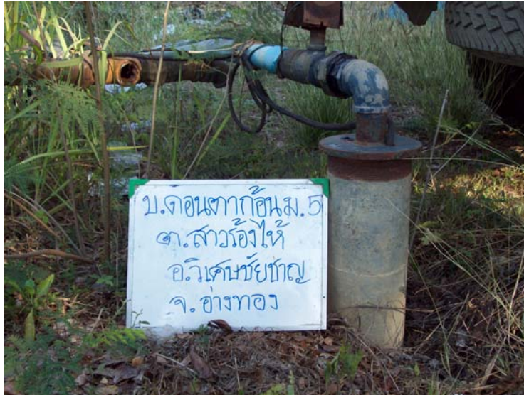
ก่อนเข้าดำเนินการอุดกลบ่อน้ำบาดาล ด้วยปูนซีเมนต์