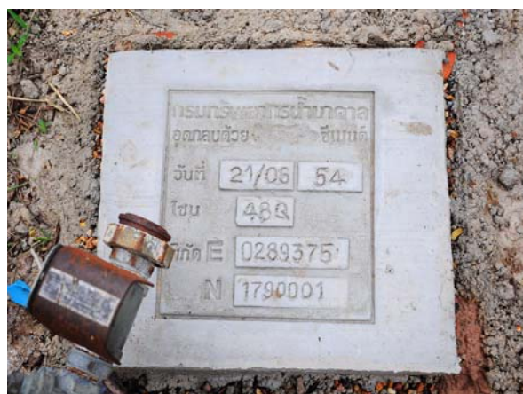
อุทกกลบ่อน้ำบาดาลด้วยซีเมนต์ เสร็จเรียบร้อย