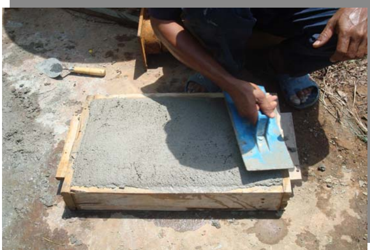
เทพื้นคอนกรีตปิดปากบ่อ

ดำเนินการอุดกลบ่อน้ำบาดาล ด้วยดินเหนียว เสร็จเรียบร้อย