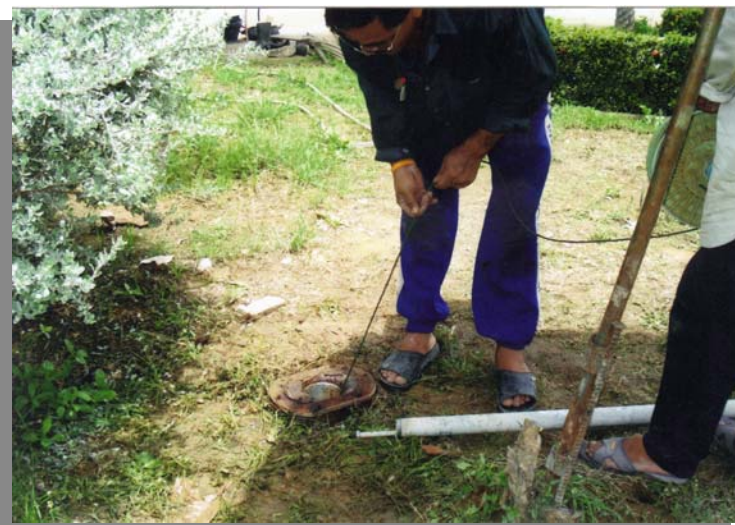
วัดระดับความลึกบ่อน้ำบาดาล