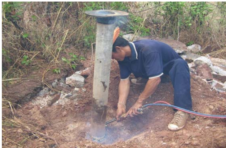
ตัดท่อกรูบ่อ ให้เสมอพื้นดิน