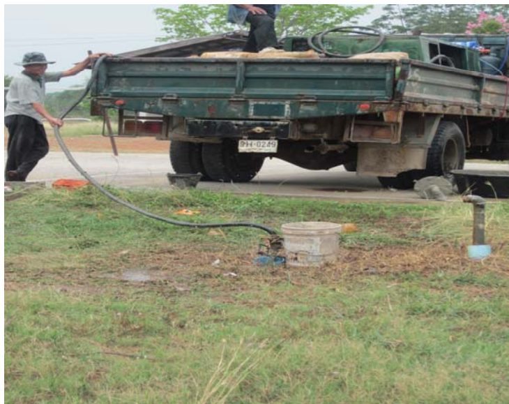
ลงท่อลมอัดอากาศเพื่อเป่าล้างบ่อ