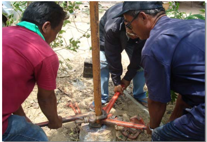
ถอนอุปกรณ์เครื่องสูบน้ำออก