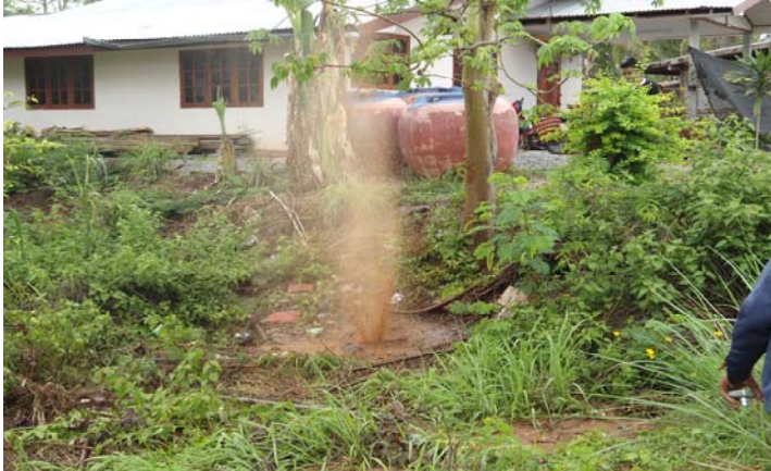
เป่าล้างบ่อน้ำบาดาล ก่อนทำการอุดกลบ