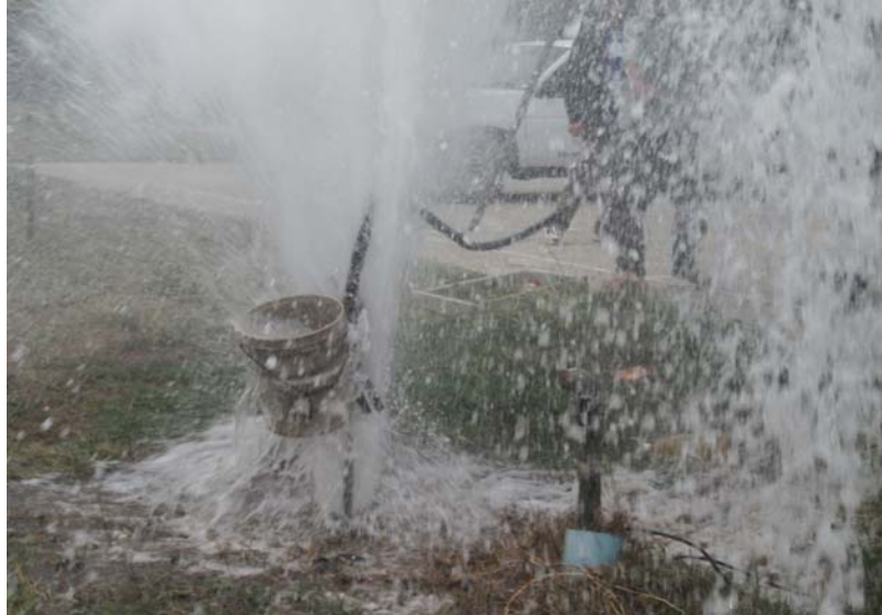
การเป่าล้างบ่อน้ำบาดาล