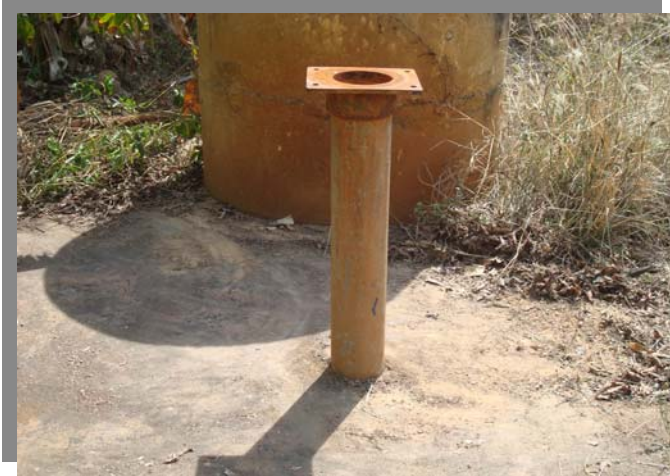
บ่อน้ำบาดาลที่จะดำเนินการอุดกลบ